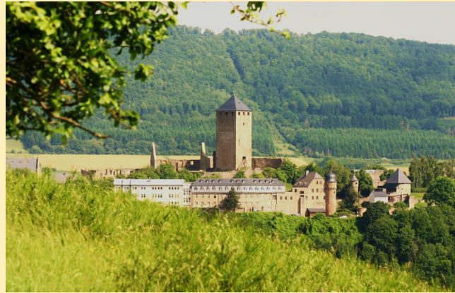
Die Burg Lichtenberg bei Kusel ist ein Wahrzeichen des Kuseler Musikantenlandes und beherbergt u. a. das Musikantenlandmuseum.