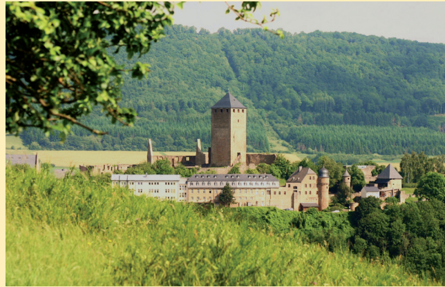
Die Burg Lichtenberg bei Kusel ist ein Wahrzeichen des Kuseler Musikantenlandes und beherbergt u. a. das Musikantenlandmuseum.