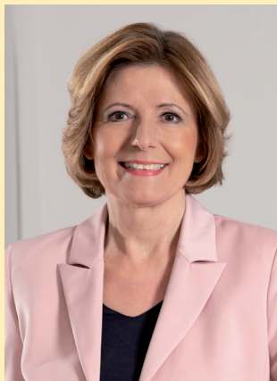
Schirmherrin Ministerpräsidentin Malu Dreyer